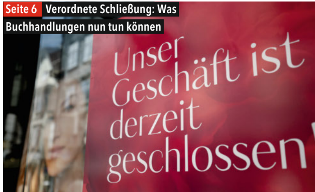
Seite 6 Verordnete Schließung: Was Buchhandlungen nun tun können