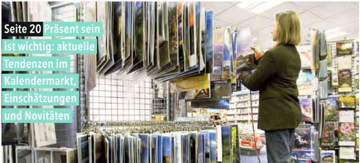
© Ferdinando Iannone - Börsenverein Baden-Württemberg (v.l.)

Seite 20 Präsent sein ist wichtig: aktuelle Tendenzen im Kalendermarkt, Einschätzungen und Novitäten