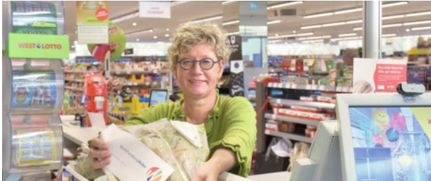
Seite 10 Auch ein kleineres Sortiment kann mit einem Supermarkt kooperieren: Erfahrungen der Buchhandlung Weber in Erkrath

ab Seite 22 Aktuelle Zahlen, Novitäten und jede Menge Hintergründe zum Jugendbuchmarkt: die Spezial-Strecke zum Kinder- und Jugendbuch